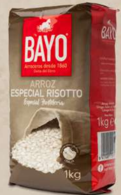
ARROZ ESPECIAL RISOTTO