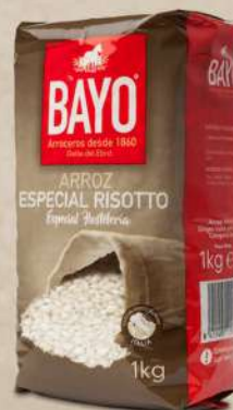
ARROZ ESPECIAL RISOTTO